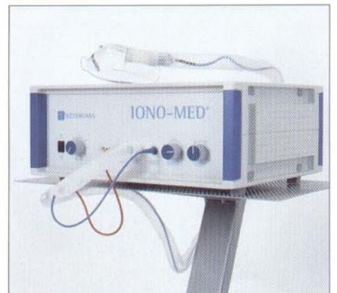
Aeroionen-Inhalation. Durchflussmenge und Intensität sind einstellbar. Mit Zeitschaltuhr für die Inhalationsdauer. Aeroion inhalation. Adjustable flow volume and intensity. With a timer for length of inhalation.