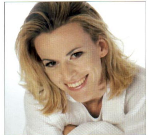
In great shape, fit and healthy through aeroion inhalation. Top in Form, fit und gesund durch Aeroionen Inhalation.

Weyergans High Care AG An Gut Boisdorf 8 · D-52355 Dueren Tel. +49-(0) 24 21-96 78-0 Fax +49-(0) 24 21-96 78-20 info@high-care.de · www.weyergans.com