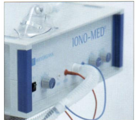
The extensive range of uses of aeroion inhalation and the minimum supervision required are a lucrative expansion of your therapeutic services. Das breite Einsatzgebiet der Aeroionen-Inhalation und geringe Personalbindung sind eine lukrative Erweiterung Ihres Therapieangebots.

Activates and strengthens the whole metabolism. Aktiviert und kräftigt den gesamten Stoffwechsel.